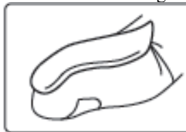
O unitate de vârf de deget