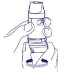
'Klik' Figuur 2

5. Neem het mondstuk tussen uw tanden (niet bijten). Sluit uw lippen en adem krachtig en diep in door het mondstuk (zie figuur 3).